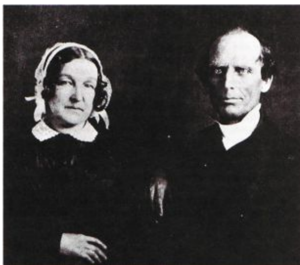
Charles (Karel) G. Finney - Kazatel 19 století