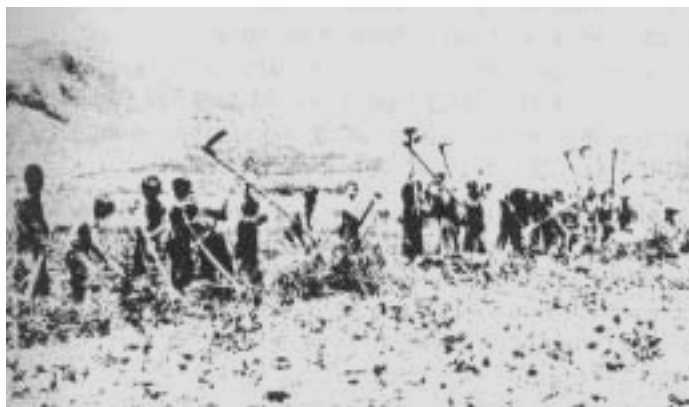
Adullamští chlapci jsou naprosto obyčejní chlapci. Zde pracují na zahradě.