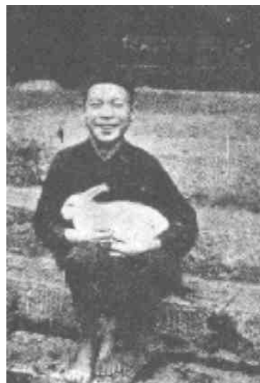
Takových je království nebeské. Lidé a zvířata v nebi sdílejí vzájemnou lásku

Existuje město, ve kterém se nikdy nestmívá, nepotřebuje slunce ve dne ani měsíce v noci. Jeho zlaté ulice nepotřebují úklid. Jeho drahými kameny posázené příbytky nepotřebují nikdy opravit. Existuje město, ve kterém nenajdete ceduli, na které je uvedeno, kde se nachází nejbližší lékař, nejsou tam totiž nemocní ani ochrnutí, není tam nemoc ani zármutek; je to město, na jehož zlatých dveřích nejsou černé pásy, na jehož ulicích nejsou pohřby. Je to město, kde neexistuje deprese ani žádný nárek; je to město, kde smrt byla pohlcena ve vítězství; město čisté, ničím nsvázané radosti. Existuje město, ve kterém není nikdy obloha pokrytá mraky, ani tam nejsou bouřky. V tomto městě není nikdy boj o přežití. Není v něm sobecké soupeření. Není tam žádná sobecká chamtivost, která vzbuzuje podezření. Nikdo se nestará o to, co bude jíst ani o to, co si oblékne. Běloskvoucí oděvy nikdy neztratí svoji bělost ani lesk. Ovocné stromy nejsou nikdy neplodné. Voda života nikdy nevyschne a kdokoliv z ní může pít.