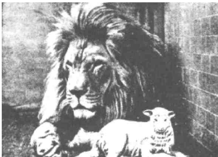
Lev s beránkem se budou pást. Zuřivá a dravá přirozenost již nebude a vše bude uvedeno do ještě vyššího stavu než na počátku, kdy vše bylo „velmi dobré“.

Podobné přenádherné scény v ráji byly opakovaně viděny větším množstvím dětí z Adullam. V ráji viděly stromy nesoucí lahodné ovoce, nádherné květiny všech barev a odstínů, vydávající nádhernou vůni i ptáky s nádherným peřím, zpívající radostné písně chvály. V tomto parku byla také zvířata všech možných velikostí a druhů: velcí i malí jeleni, velcí lvi, velcí sloni, roztomilí králíci, a všechna možná domácí zvířata, jaká na zemi nikdy neviděly.