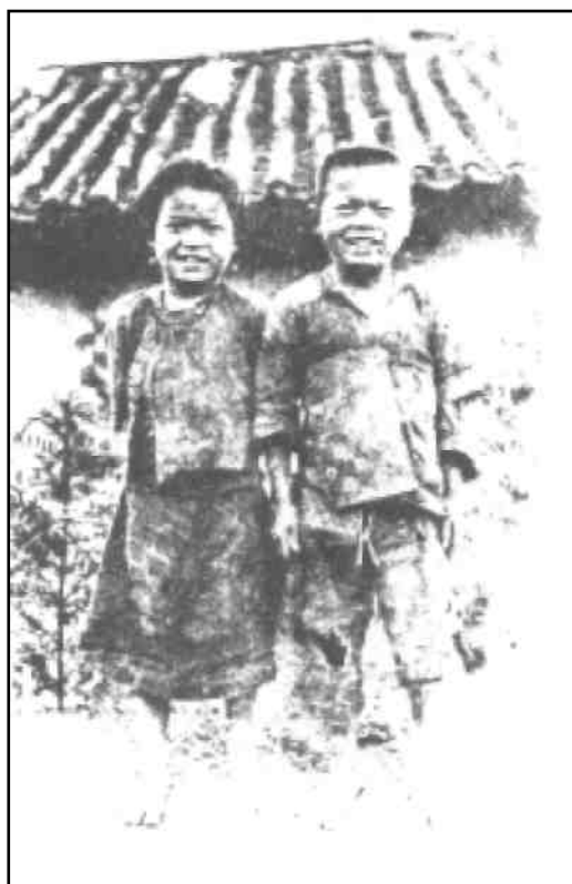
Dva mladí věřící

Na travnatém palouku mezi stromy, květinami a ptáky v ráji viděly děti skupiny vykoupěných, jak tancují a hrají na trumpety spolu s anděly. Někdy se připojily ke šťastné slavnostní skupině, ve které byly malé i větší děti spolu s dospělými, ale kde nikdo nebyl starý. Jaké nebeské scény! Jací nebeští zpěváci! Jaká radost mezi anděly a vykoupěnými!