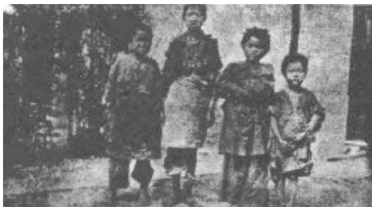
Někteří další „opovrhovaní“

Cožpak v tom, co Pán udělal a zjevil těmto odhozeným a zavrženým žebráckým chlapcům a děvčatům není důkaz Slova Božího? „Nemnozí moudří podle těla, nemnozí mocní“ následují tu úzkou cestu jednoduché víry v Boha. On si stále může a také si vybírá tyto opovrhované a jednoduché čínské děti ulice a příkopů, aby „zahanbil ty věci“, které jsou tak učené a moudré v tomto věku bezbožného myšlení a světské moudrosti.