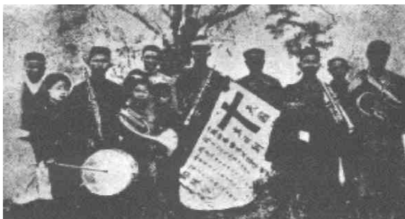
Hudební nástroje jsou dost nedokonalé v porovnání s harfami, trumpetami a jinými hudebními nástroji, na které se budou hrát ty ztracené akordy v tom městě nekonečné radosti.

Dědictvím každého v nebi je radost a nadšení mladosti. Ale zde na zemi, i během našich nejšťastnějších dnů, stále žijeme v hliněných nádobách. V našich nejlepších chvílích cítíme, že existuje ještě větší radost a štěstí, které je téměř na dosah, ale než jich můžeme dosáhnout, jsme odtaženi pryč tíhou této hlíny. Děti skotačí a hrají si. Běhají, válí se a skáčou samou radostí. Zpívají a křičí. Občas se jejich radost a štěstí zdá být úplné. „Neboť takových jest království nebeské.“ Ale všechny naše největší radosti a požitky mladosti na zemi budou nahrazeny mnohem převyšujícími, budou „nevyslovitelné“, až tohle naše hliněné tělo, které nás zadržuje, bude nahrazeno tělem dokonalým.