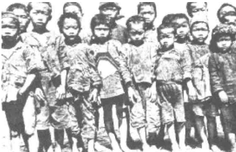
Chlapci žebráci, kteří našli svůj domov v sirotčinci Adullam

Jako naplnění Písma, které praví, že „v posledních dnech... vaši synové ...budou prorokovat“ (Skutky 2:17), jeden desetiletý chlapec, který býval žebrákem v Číně, byl použit jako mluvčí pro Pána, aby nám přinesl poselství skrze přímou inspiraci.