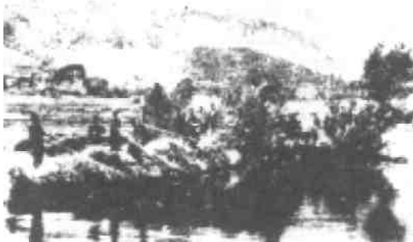
Adullamští chlapi odpočívají u tichých vod. Věří, že když jednoho dne opustí tyto krásné přírodní scény, čeká je mnohem nádhernější příroda v Edenu Nového Jeruzaléma, který je v nebi.

Tento ráj je veliký „park“ neobyčejných divů. „Ráj“ znamená „Eden“. „Eden“ znamená „ráj“. „Eden“ je „park“; „ráj“ je proto „park“. Biblický slovník Peloubeta mluví o „ráji“: „ Tohle slovo je původem z Persie, a je použito v Septuagintě jako překlad slova „Eden“. Znamená zahradu plnou rozkoší a ovoce, zahradu nebo také země rozkoše, něco jako anglický park “. Ale tento „park“ v nebi je pouze „tak trochu“ jako park pozemský, protože je mnohem větší než pozemské parky, jak rozlohou, tak i krásou, poněvadž Boží myšlení je větší než to pozemské. I ty nejlepší, nejkrásnější parky s řekami, s křišťálovými jezírky, se stromy, různými voňavými květinami, ptáky a zvířaty jsou pouze nedokonalou napodobeninou v porovnání s Edenem, který byl na „počátku“.