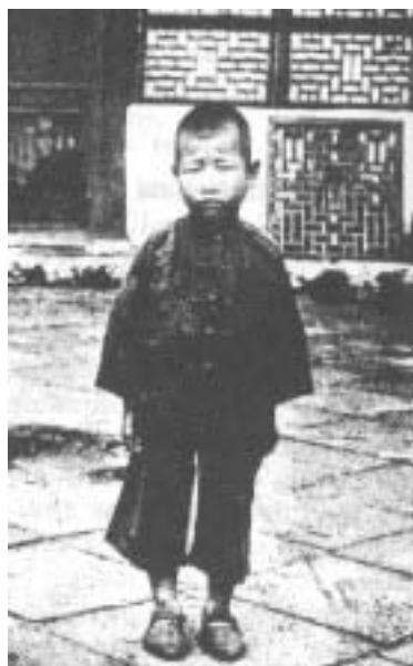
MOŽÍŠ Pán ho pokřtil Duchem svatým přesně tak, jak to je zaznamenáno v Bibli

Nikdo z přítomných neměl pochybnosti o tom, že Pán k nám mluvil hned v počátcích tohoto vylití Ducha, když promlouval skrze toho nejmenšího a nejpokornějšího ze všech dětí. Bylo něco velmi zvláštního v jeho hlase, byla to pronikající moc těch slov, moc, která vás uchopila za srdce způsobem, který nelze popsat. Nikdy v životě jsme neslyšeli poutavější hlas od Boha v žádném kázání za všechny naše dny. Všichni jsme věděli, že slyšíme řeč přímo od Pána. Více Adullamských dětí později mluvilo v prorocktví, takže jsme se čím dál víc podívovali nad těmi zázraky, které se děly, když Pán promlouval tyto podivuhodné věci Boží. Zjevoval nám svoje plány a záměry a použil si k tomu odhozené „nic“ této země, ty, kteří byli nedávno žebráky, aby je učinil mluvčími živého Boha. Skrze ně mluvil přímou inspirací, vzdělával a budoval tuto malou skupinku jednoduchých věřících, obmytých krví Ježíše, právě spasených z fyzické i duchovní beznaděje